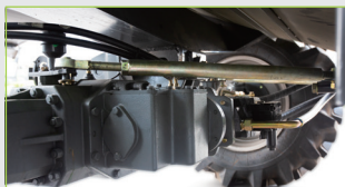
Chassis de quatro acionamentos hidráulicos